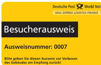
Gelbe Ausweise für Konzernangehörige

Herzlich willkommen für alle Besucher. Damit sich alle Besucher ungehindert in unserer Zentrale bewegen können, gibt es zwei spezielle Ausweise für Besucher: einen für Konzernangehörige (gelber Ausweis) und einen für sonstige Besucher und Gäste (weißer Ausweis).