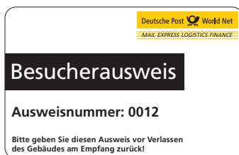
Weißer Ausweise für sonstige Besucher und Gäste

Die Besucherausweise müssen gut sichtbar mitgeführt werden. Bitte sprechen Sie Besucher an, die keinen Ausweis tragen. Sie helfen uns, die Sicherheit in unserer Zentrale zu garantieren.